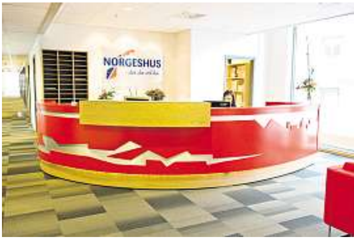
Resepsjonsskranker er Meldal-bedriftens spesialitet. Her fra Norgeshus på Melhus.