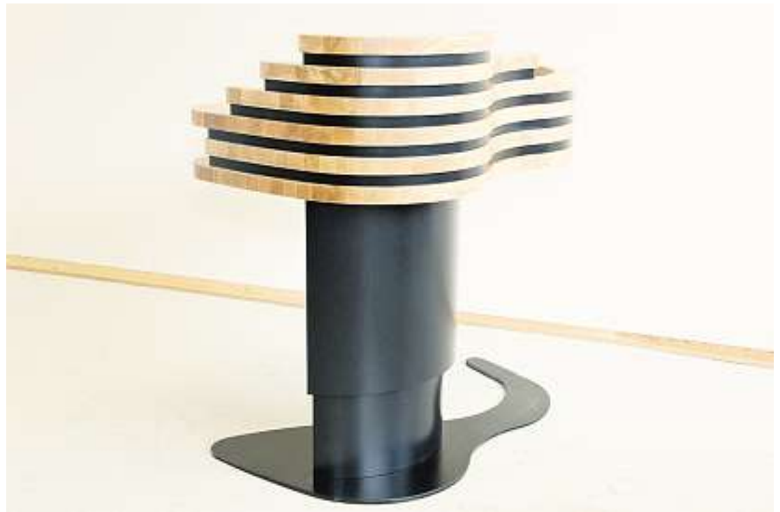
Talerstoler produseres i alle varianter, og til alle priser.

arbeidskraft, blant annet fordi de fleste linjene for møbel-snekkerfag er lagt ned, sier Lium.